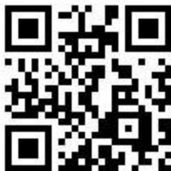
Google 線上報名網址 QR-Code

(二)報名系統網址： https://reurl.cc/3ORlyX (網址英文字之大小寫需一致)