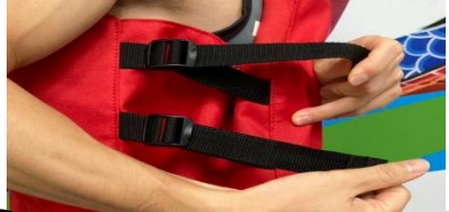
2 腰部左右各2條帶子拉緊