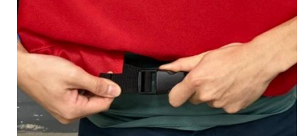
4 扣環扣好後，帶子拉緊