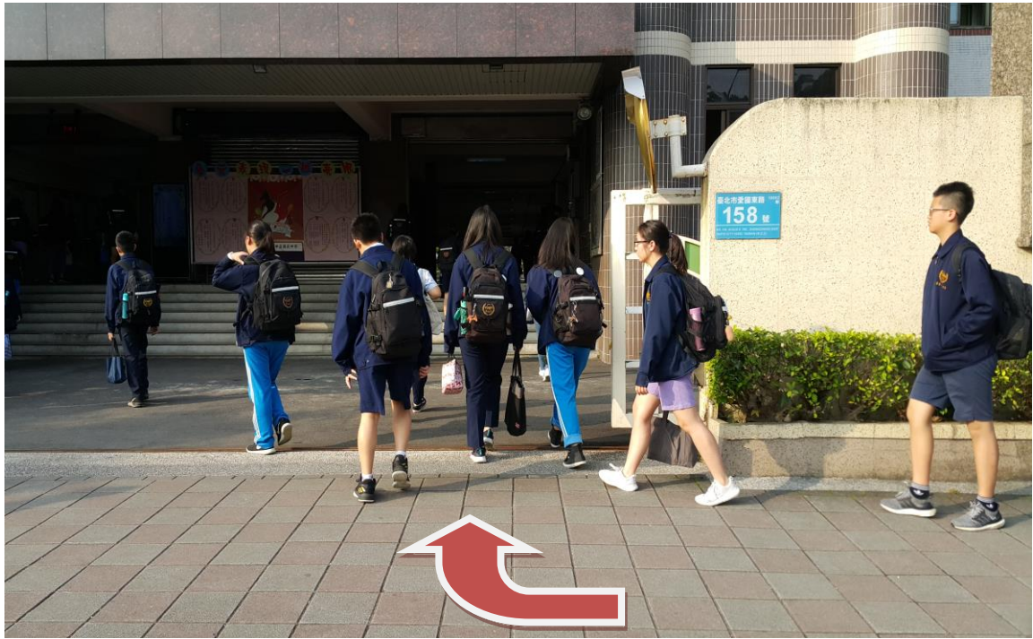
人車分道-學生出入從大門