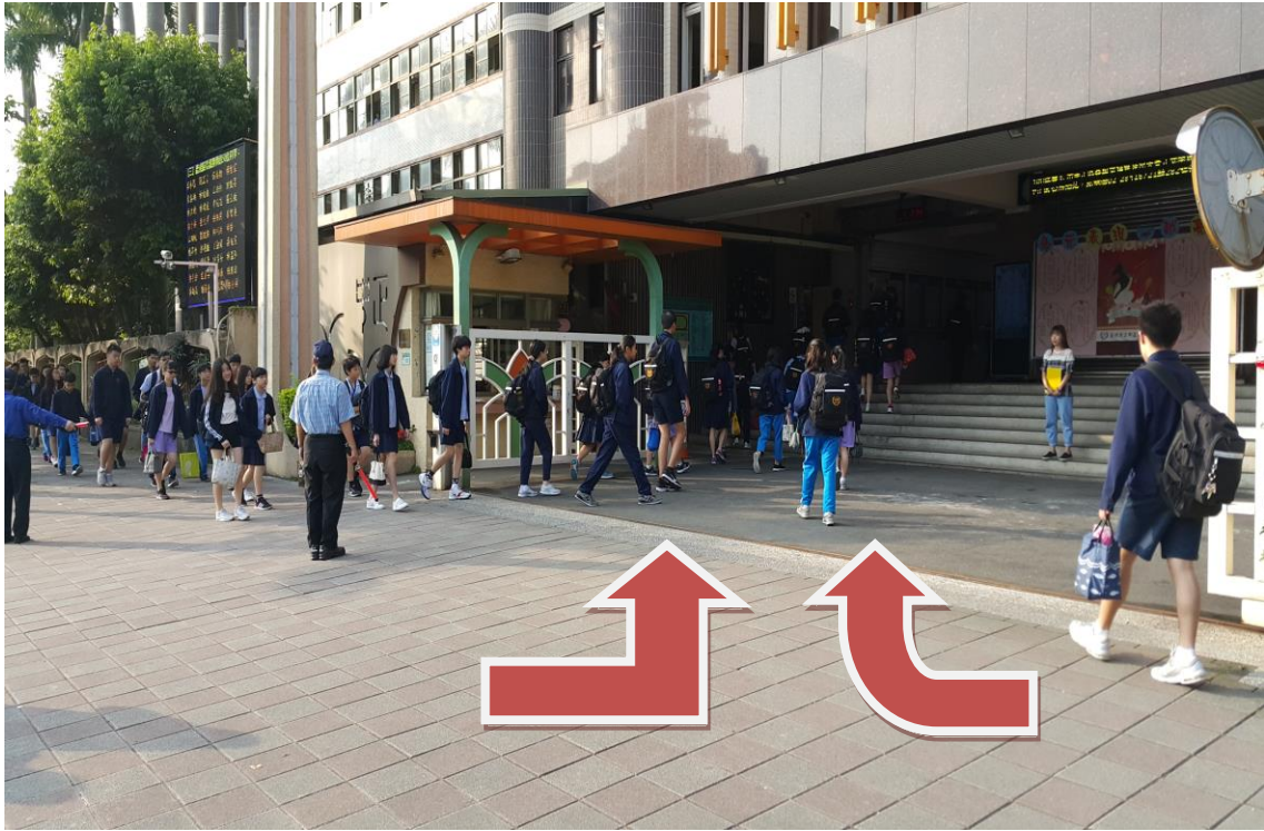
人車分道-學生出入從大門