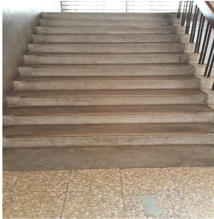
落實校內交通情境設置與教學(改善前)