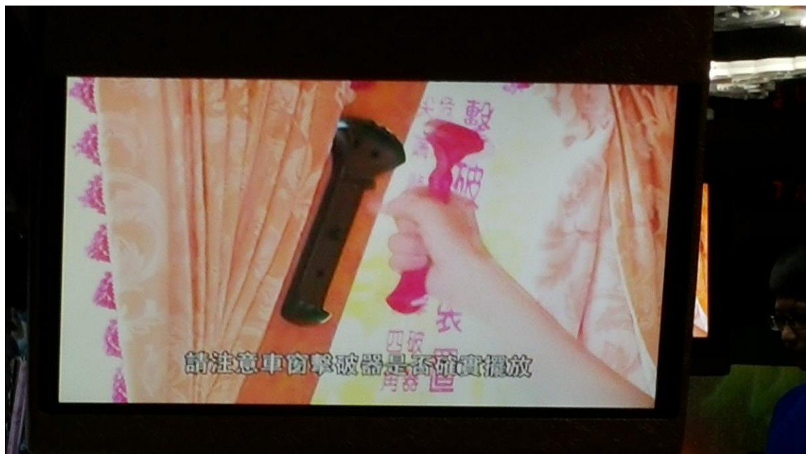
九年級畢旅交通安全車輛安全審核、逃生演練、司機酒測