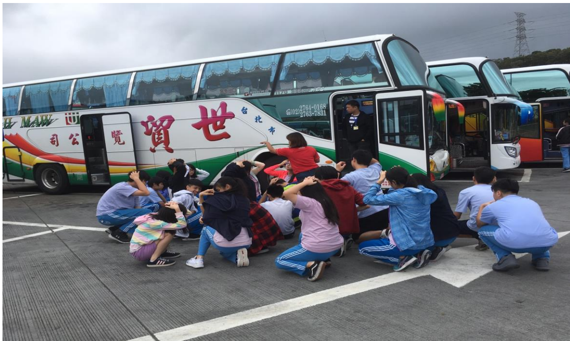
九年級畢旅交通安全車輛安全審核、逃生演練、司機酒測