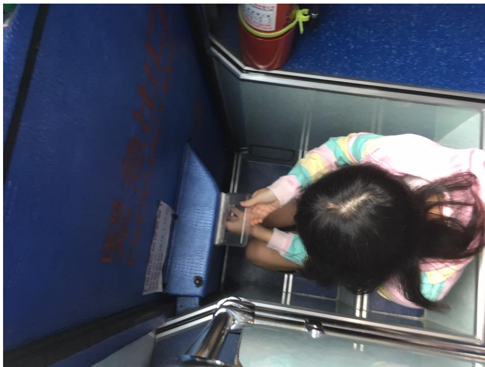
九年級畢旅交通安全車輛安全審核、逃生演練、司機酒測