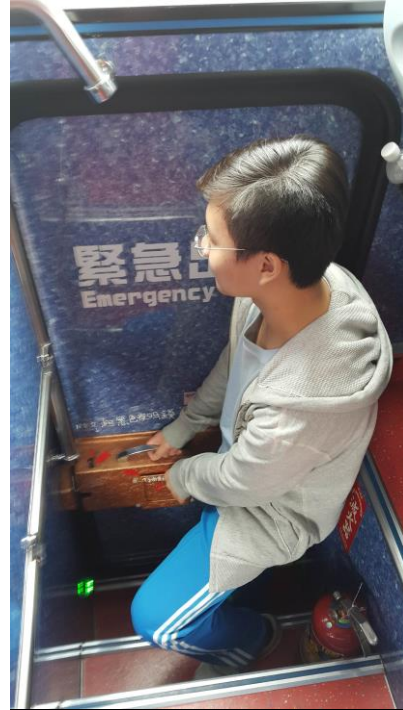
九年級畢旅交通安全車輛安全審核、逃生演練、司機酒測