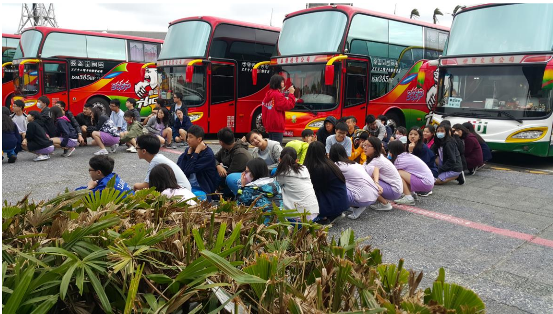
九年級畢旅交通安全車輛安全審核、逃生演練、司機酒測