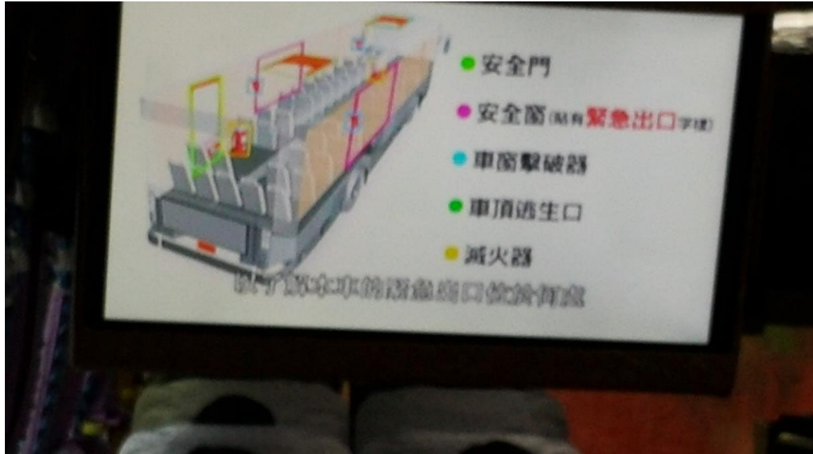
九年級畢旅交通安全車輛安全審核、逃生演練、司機酒測