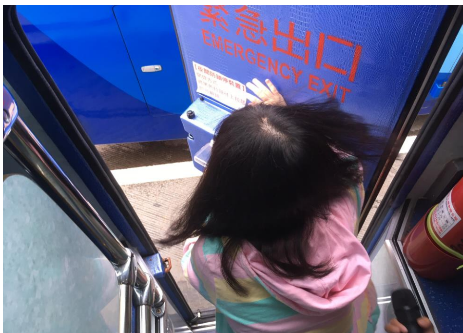
九年級畢旅交通安全車輛安全審核、逃生演練、司機酒測