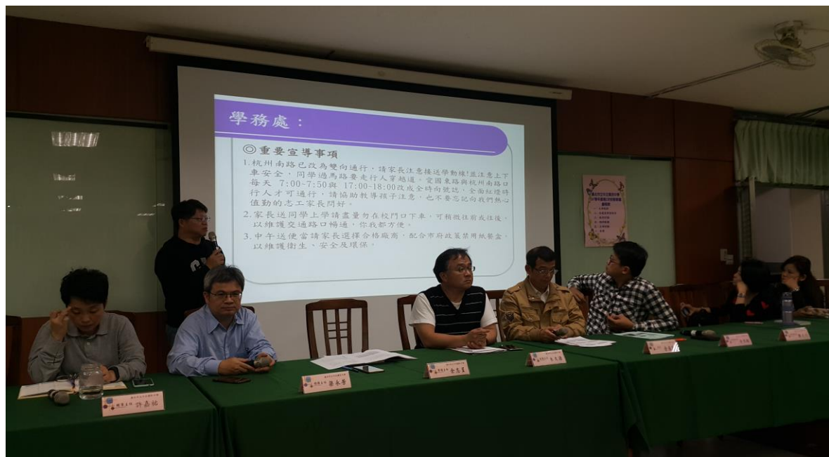
校園交通安全宣導