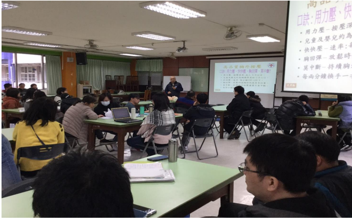
教職員工生 CPR 研習活動