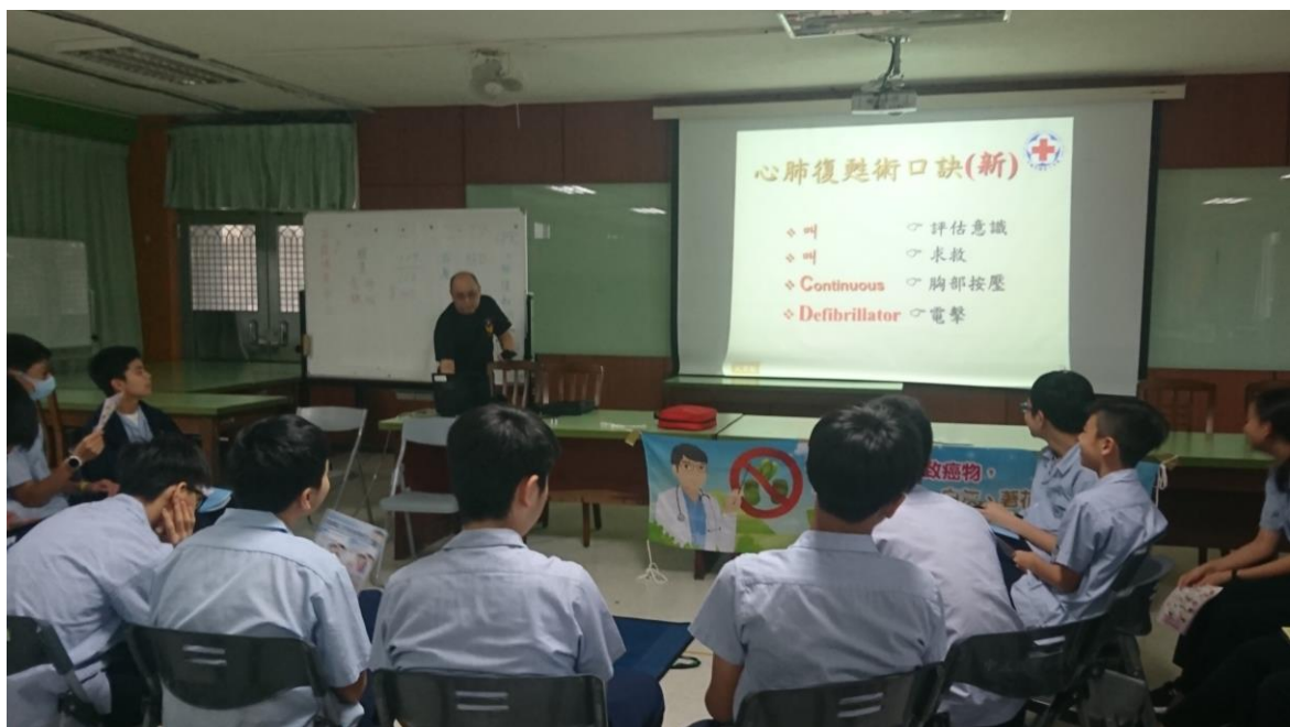
教職員工生 CPR 研習活動