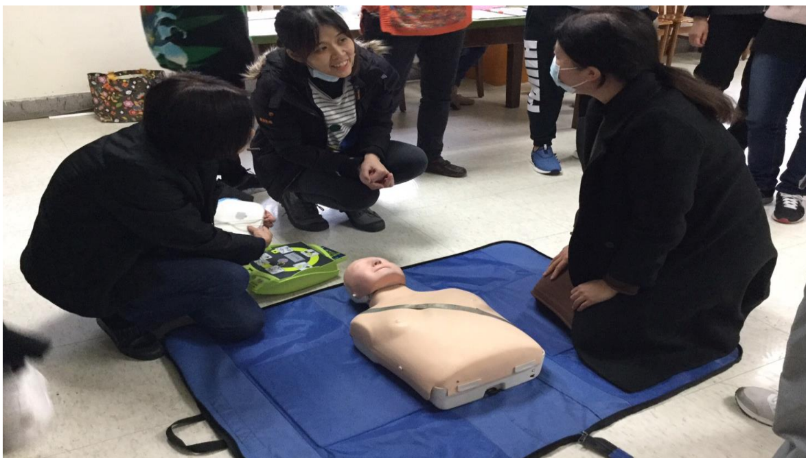
教職員工生 CPR 研習活動