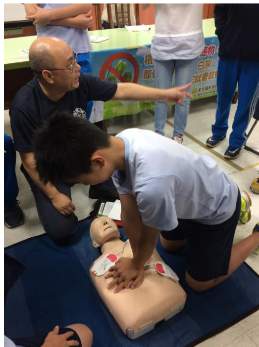
教職員工生 CPR 研習活動