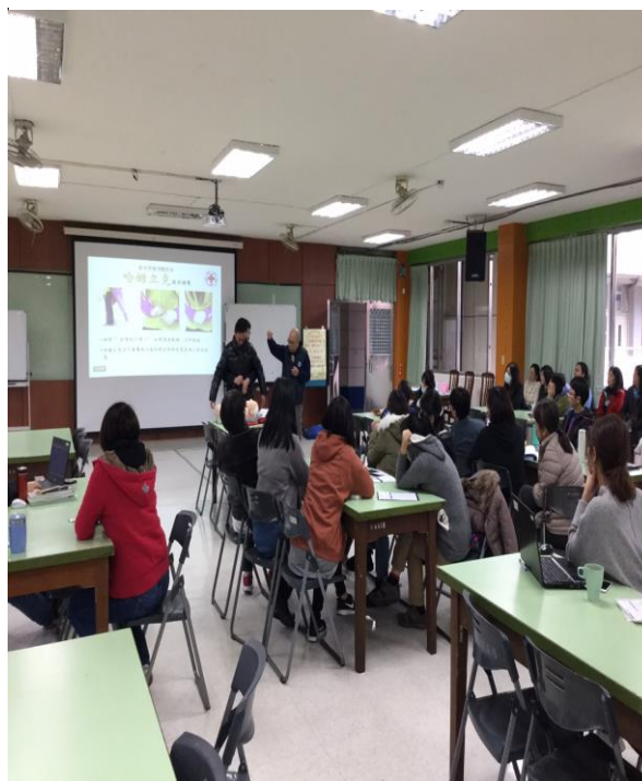
教職員工生 CPR 研習活動