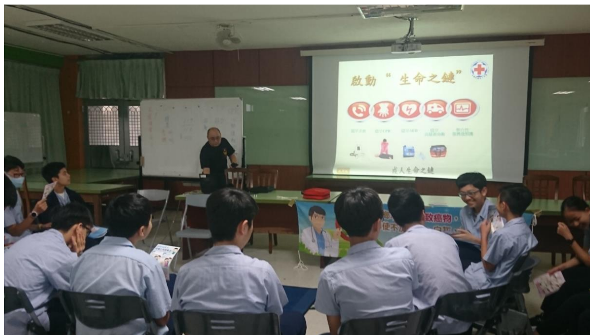
教職員工生 CPR 研習活動