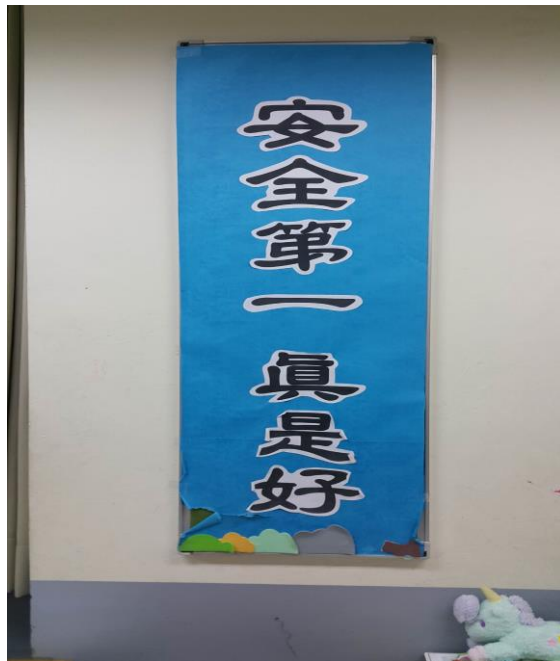
校園交通安全教室佈置