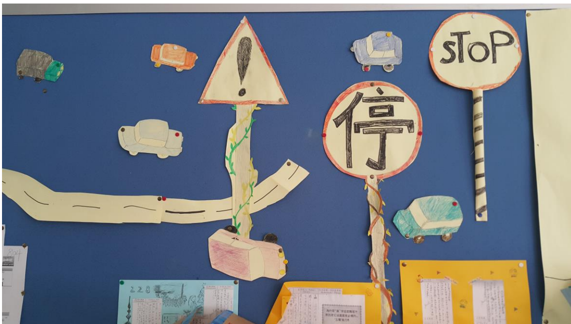
校園交通安全教室佈置