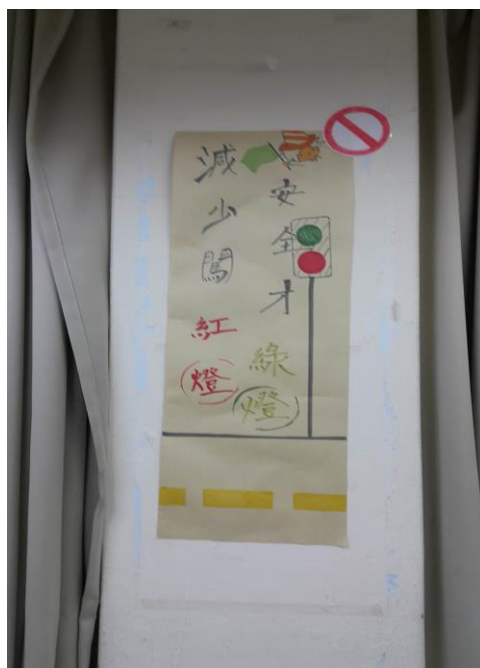
校園交通安全教室佈置