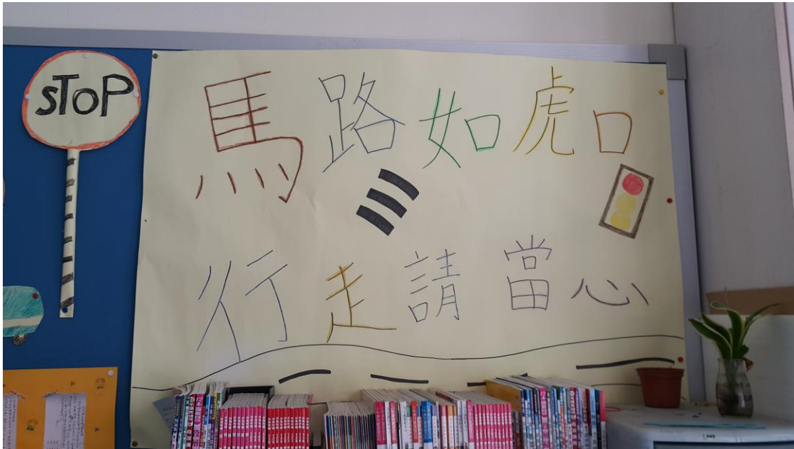
校園交通安全教室佈置