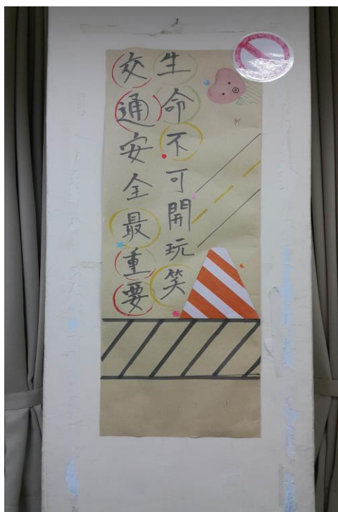
校園交通安全教室佈置