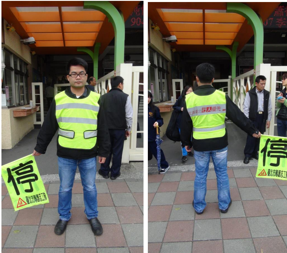
✚ 反光背心正面為魔鬼黏條，背面為字