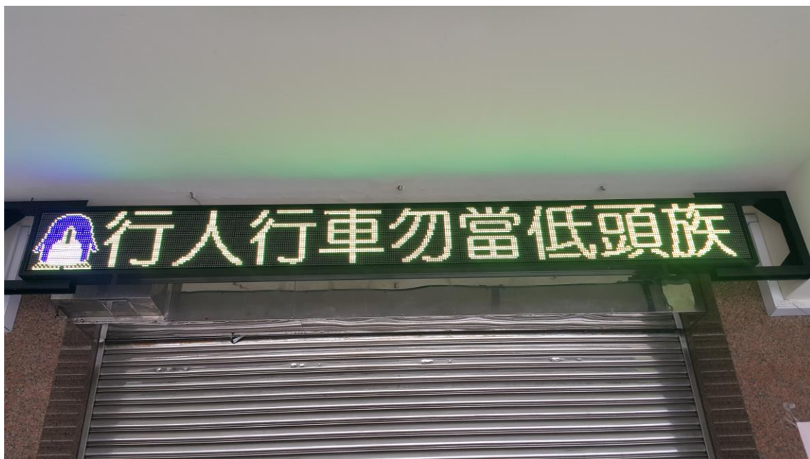
交通安全公佈欄及跑馬燈宣導