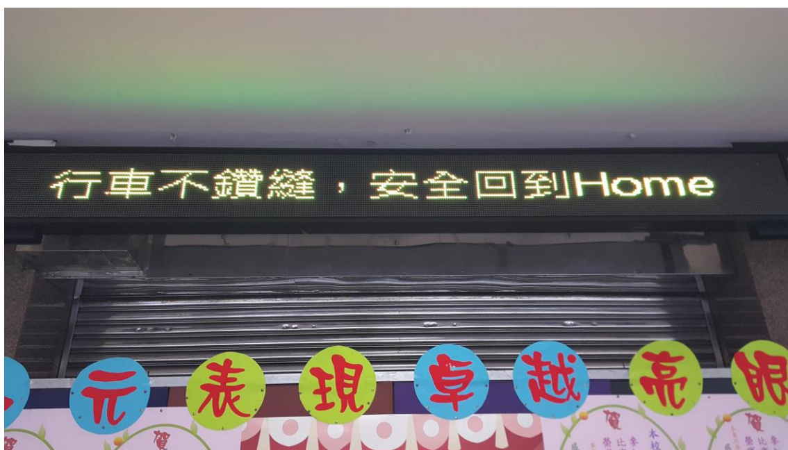
交通安全公佈欄及跑馬燈宣導