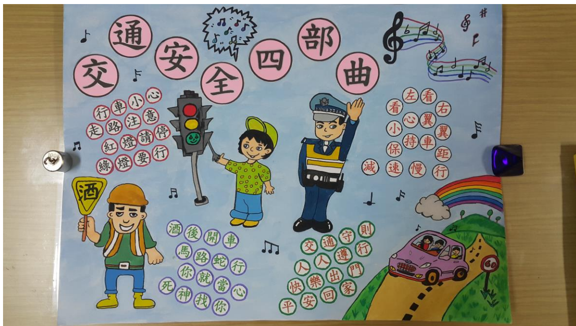
參加臺北市交通安全競賽學生作品照片