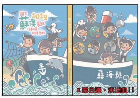
X 未留包折白邊是錯誤的!