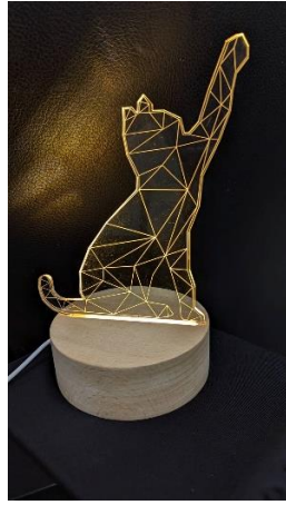
(雷射光雕小夜燈樣本)