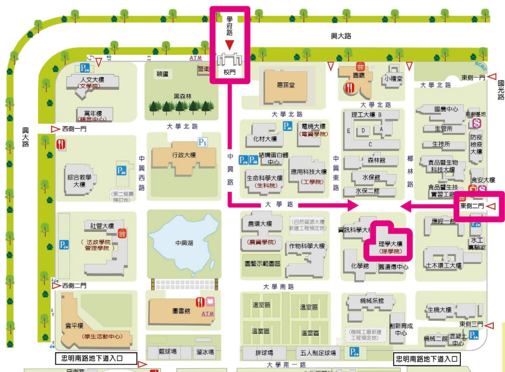
▲中興大學校園平面配置圖